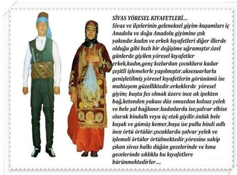
Görsel.3: Geleneksel Sivas Folklorik kıyafeti